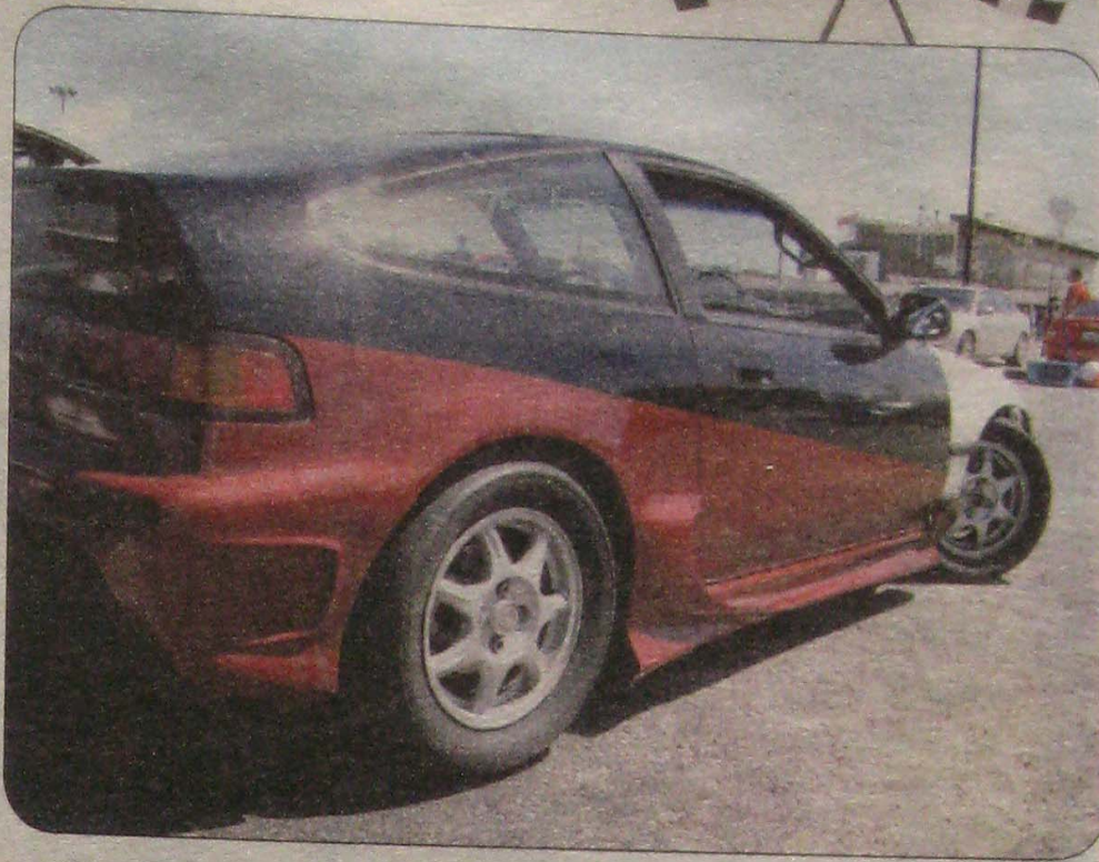
CRX-а (Reksa) на Алекс чака поредния старт. Целият интериор на автомобила е премахнат като единствено е оставена шофьорската седалка. (снимките долу)

На по-професионално ниво това би било задължително, при нас това е по-скоро удоволствие или хоби да го наречем - не мисля, че е от толкова голямо